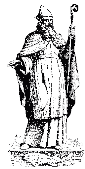
S. Corentin (t. 1, p. 326-328)

Nous partagerons un moment convivial après la célébration pour renforcer les liens de notre communauté chrétienne. Rejoignez-nous nombreux pour ce temps de partage et de solidarité !